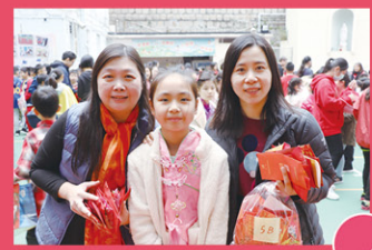
師生共聚慶祝新年，真是樂也融融！