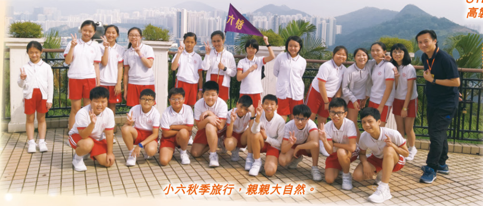
小六秋季旅行，親親大自然。