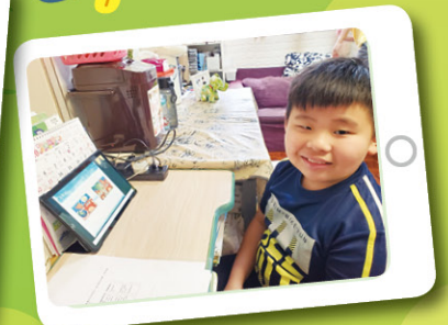
停課期間，同學們用心於學，完成老師安排的學習內容及課業。