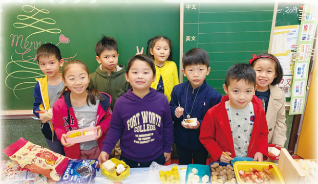
同學們一起享受派對食物，真美味！