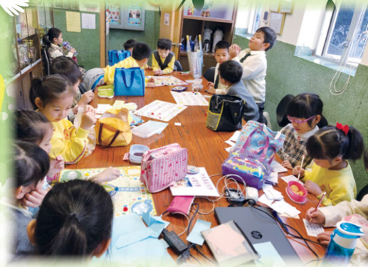
小息時，同學們投入於宗教活動中。