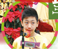
同學代表誦讀信友禱文。

本校在十二月二十日舉行聖誕禮儀及聯歡會。在聖誕禮儀中，同學們透過唱聖詩、讀經、信友禱文等，迎接聖誕節的來臨。禮儀後，老師和同學們在課室裏舉行聯歡會。整個活動在一片愉快的氣氛下結束。