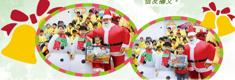
同學們從聖誕老人和小雪人手上接過抽獎的禮物，多興奮啊！

本校在十二月二十日舉行聖誕禮儀及聯歡會。在聖誕禮儀中，同學們透過唱聖詩、讀經、信友禱文等，迎接聖誕節的來臨。禮儀後，老師和同學們在課室裏舉行聯歡會。整個活動在一片愉快的氣氛下結束。