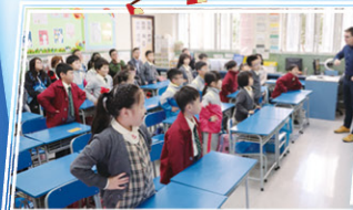
同學們踴躍參與課堂活動。

本年度公開課於十二月二日舉行，家長踴躍參與，同學們積極投入於課堂活動中。家長滿意課堂的安排，並讚賞本校老師具備親切的態度及教學的熱誠。