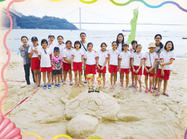
同學們由設計定稿、掌握堆沙技巧到正式比賽的兩個月裏，學習到堆沙並不只是「堆泥沙」呢！