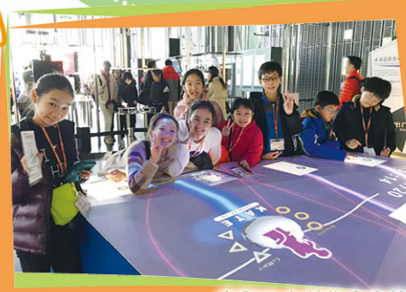
參觀日本科學未來館令我們能體驗最新的科學技術。