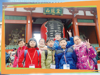
我們一起到淺草寺雷門及仲見世商店街遊覽。