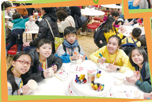
看我們設計的杯麵作品多漂亮！