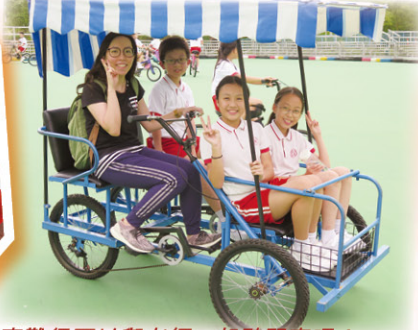
真難得可以與老師一起騎單車呢！