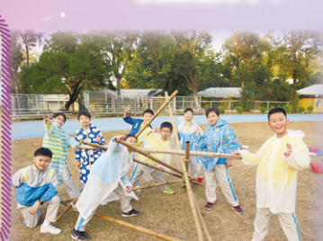
我們合力製成羅馬炮架，多厲害！