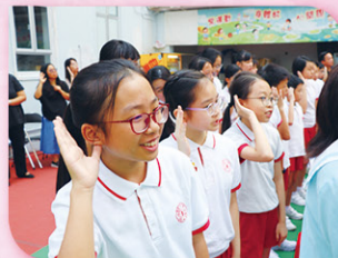
同學們歌唱聖詠，並以動作配合。