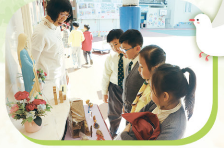
同學們一邊聆聽桃桃姨姨的講解，一邊欣賞「馬槽」展覽。