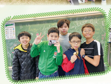
最後一年的小學聖誕聯歡會，當然要拍照留念啊！