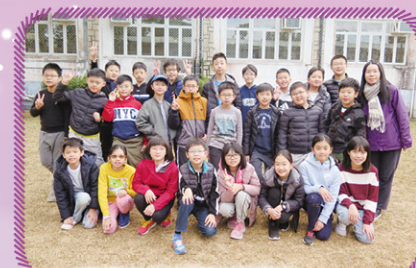
我們在畢業營留下了美好的回憶呢！