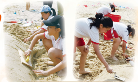
比賽當天，同學們爭取一分一秒，堆砌出不同的海洋生物，透過作品帶出保育的訊息。

參加視藝精英組活動，增加了我對各藝術媒介的認識及興趣，我們除了嘗試不同的創作外，更有機會向專業漫畫家學習。此外，在參與堆沙比賽中，讓我不但學習到堆沙的方法，還認識到團隊合作的精神。