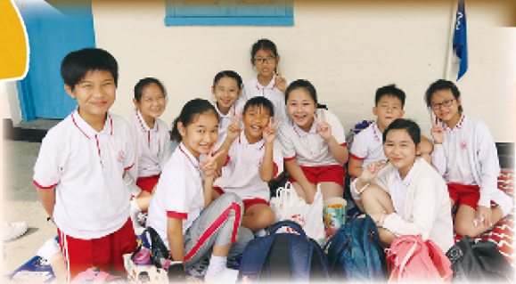
我們一邊分享食物，一邊傾談心事。