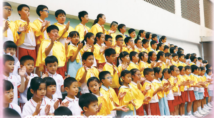
教友歌詠團的同學一邊詠唱，一邊拍手歡迎嘉賓進場。