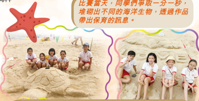
同學們的付出，除了贏得獎項外，還獲得寶貴的經驗，以及珍貴的友誼。