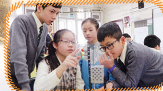
STEM教育：運用 Gigo 智高製作紅綠燈系統