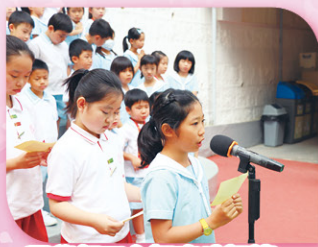
同學們正在認真地誦讀信友禱文。