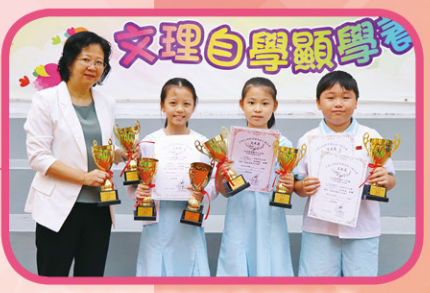
全港公開標準舞及拉丁舞大賽——完美盃