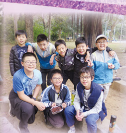
畢業了，這份友誼將會永留我們心中！