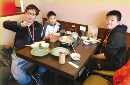
我們正品嚐日本的美食呢！