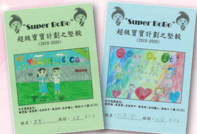
同學們用心設計小冊子的封面。