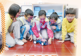
齊來看看我們 mBot 的成果！