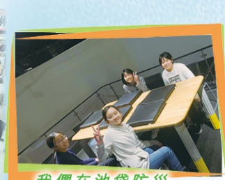
我們在池袋防災館學習防災知識。