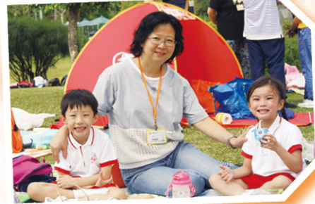
我們跟鄭校長一起野餐，真開心呢！