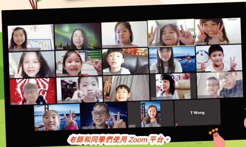
老師和同學們使用 Zoom 平台。