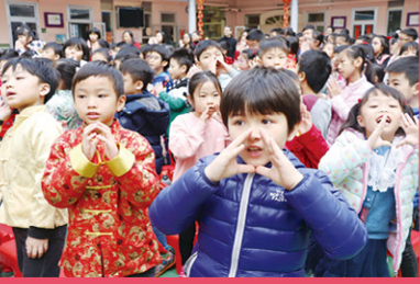
同學們投入地詠唱禮儀的歌曲。