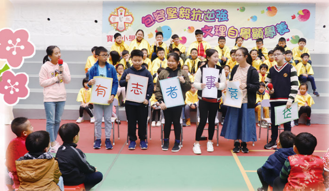
短劇提醒大家「有志者事竟成」的道理。