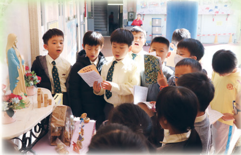
同學們正在誠心祈禱。