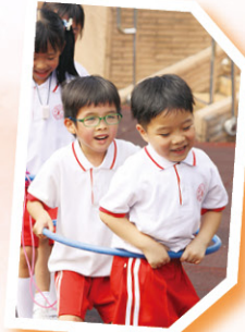
同學們在玩集體遊戲。