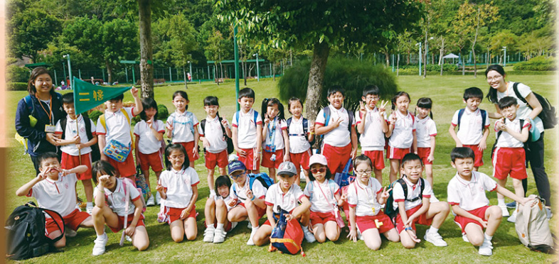
我們都留下了難忘的回憶。

在秋季旅行那天，初小和高小的同學分別到佐敦谷公園及鯉魚門公園遊玩。同學們能藉以舒暢身心、欣賞大自然景色和參與群體活動，度過了愉快的一天。