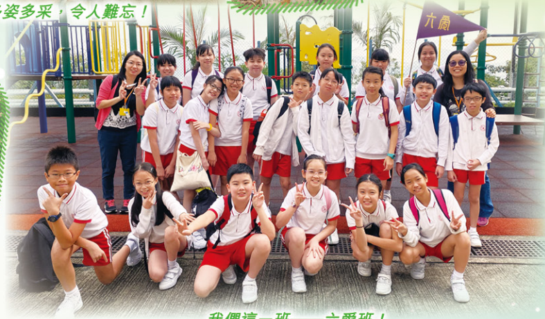
我們這一班——六愛班！