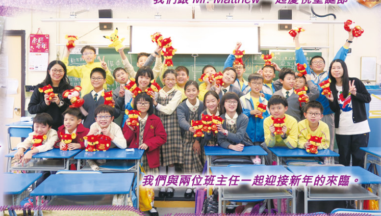
我們與兩位班主任一起迎接新年的來臨。