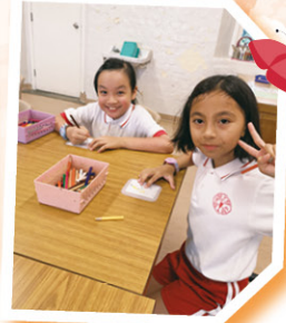
我們一起做手工創作。