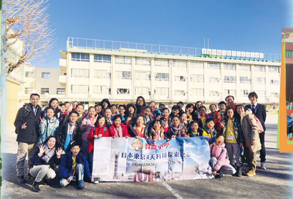
我們到連雀學園三鷹市立南浦小學校參觀，與當地學生作文化交流。