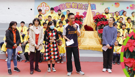
同學們正留心聆聽老師的分享。