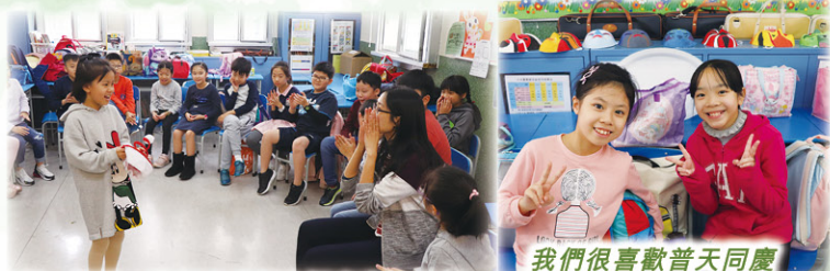
飽餐一頓後，老師和我們在課室裏玩遊戲。