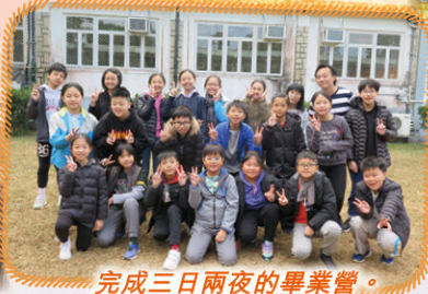
完成三日兩夜的畢業營。