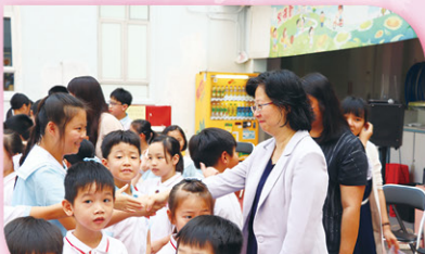
鄭校長與同學們握手，互祝平安。