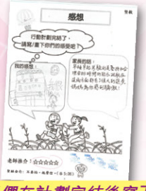
同學們在計劃完結後寫下感想，家長和老師給予回饋。

本年度學校的價值教育主題為「堅毅」，目的是希望學生們在學習上面對挑戰時，能以堅毅的態度積極尋找方法去解決問題。在 SUPER BOBO 獎勵計劃裏，透過學生自訂的短期計劃，請他們嘗試運用堅毅的精神，逐步邁向成功目標。