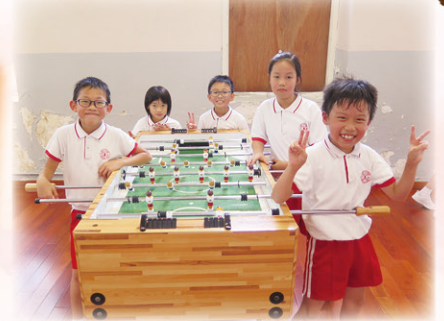
幾位小小足球員一起玩足球機。