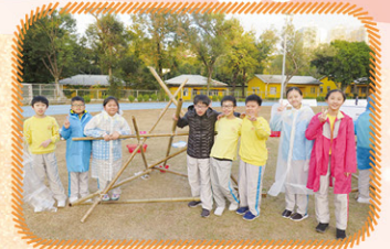
合作完成製作羅馬炮架。

時光流逝，轉眼間六年的小學生涯快要結束了。感激各位老師多年來的悉心教導和照顧，亦感謝同窗們的陪伴和留下令人回味的珍貴回憶。感恩沿途有你們的相伴，再會了！寶血小學！——這個充滿無數美好回憶的校園！