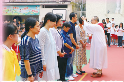
關神父為本校教職工及學生代表降福。