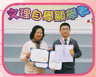
第9屆國際編程機械人競技賽——香港區賽