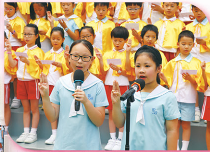
同學代表帶領全校同學宣誓，承諾常存感恩的心，以積極樂觀和堅毅的精神，勇敢面對挑戰。