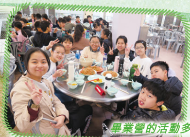
畢業營的活動多姿多采，令人難忘！