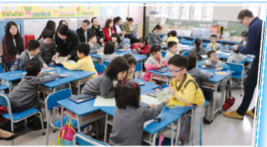
同學們以小組形式進行活動。