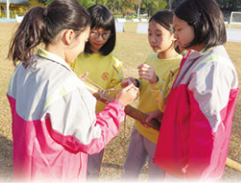
小心利用繩結製作羅馬炮架。