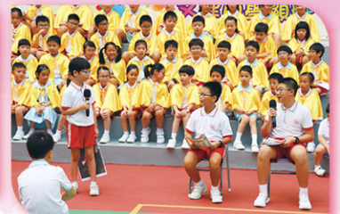
同學們正演出以「堅毅」為主題的話劇。