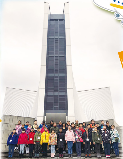
位於東京的聖瑪利亞大教堂真宏偉！

在新年假期前，我有幸參加了學校舉辦的「日本東京四天科技探索之旅」。老師帶領我和同學們在東京遊覽，還到當地的學校及不同的景點參觀，這次深度遊令我們對日本的科技和文化加深了解，受益無窮。